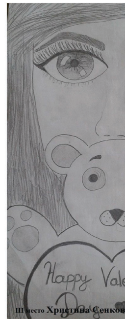
III место Христина Сенковска VIIIБ